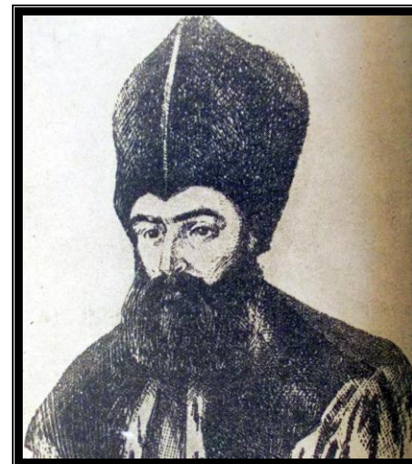
Dinicu Golescu – important cărturar român